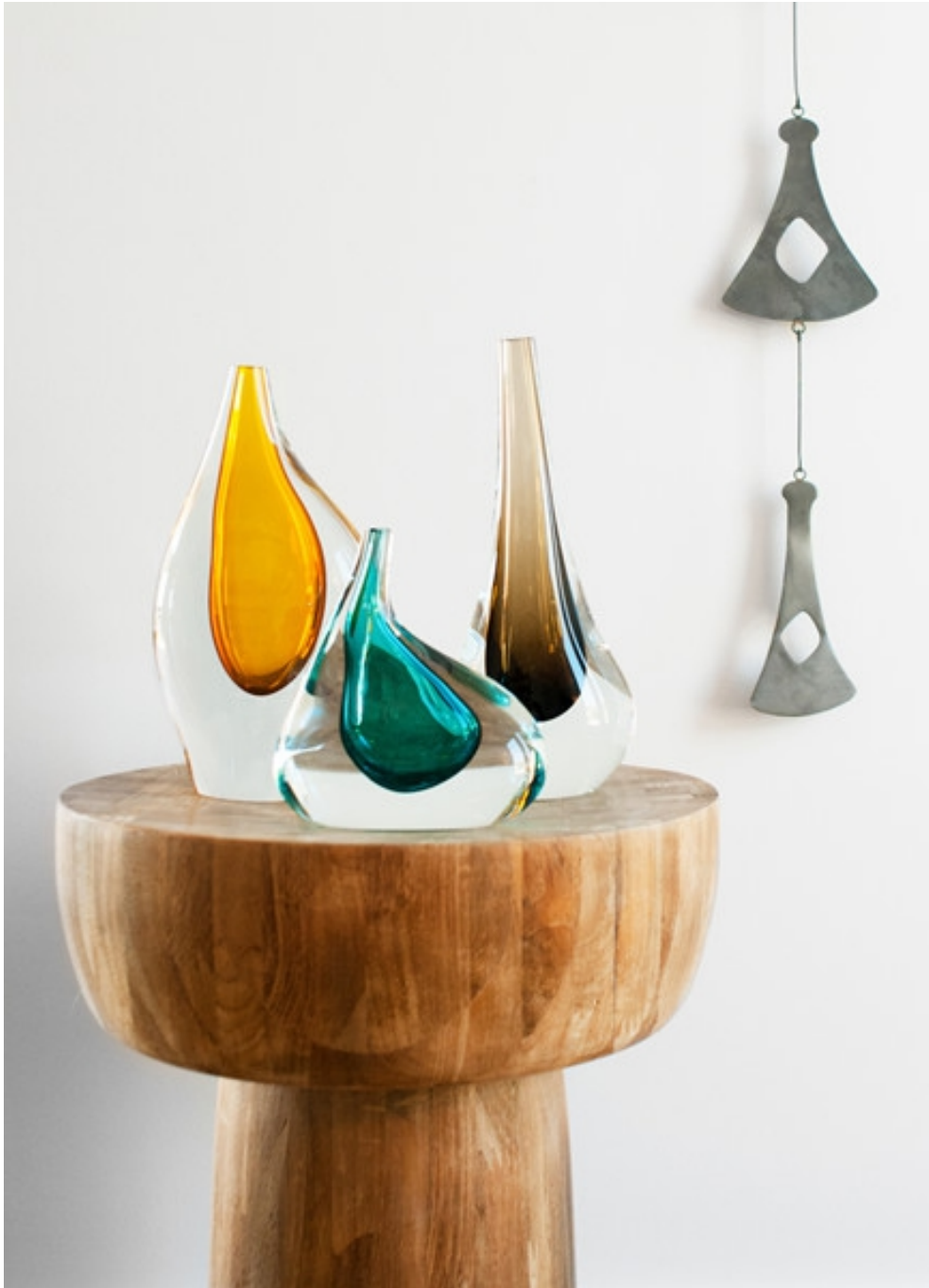
Droplet Objet by SkLO